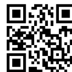
メールの申込はコチラ↑