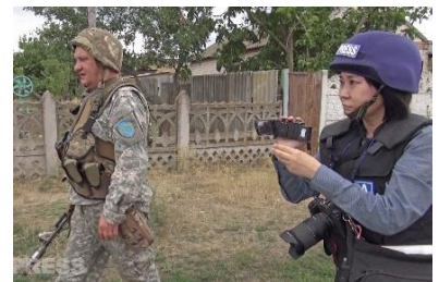
砲撃で破壊された前線地帯の村をウクライナ軍の兵士と進む

東京生まれ。デザイン事務所勤務を経て1994年よりアジアプレス大阪事務所所属。中東地域中心に取材。アフガニスタンではタリバン政権下で公開銃殺刑を受けた女性を追い、2004年ドキュメンタリー映画「ザルミーナ・公開処刑されたアフガニスタン女性」監督。イラク・シリア取材では、報道ステーション(テレビ朝日)、報道特集(TBS)などで報告。毎日新聞兵庫版で「漆黒を照らす」連載中。第54回ギャラクシー賞報道部門優秀賞、第26回坂田記念ジャーナリズム賞特別賞受賞。