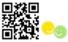
ホームページはこちら↑

★ 利用に際してのお願い ・ 講座開始の10分前から受付を始めます。時間にゆとりを持ってお越しください。 ・ 当日のお子さんの体調や状況により、お預かりできない場合があります。ご了承ください。 ・ おもちゃ、お菓子、ジュースなどの持ち込みはご遠慮ください。 ・ 欠席される場合は、キャンセル待ちの方へのチャンスにつながりますので、すぐにご連絡ください。 ★ 当日の持ち物（すべて記名して、1つにまとめてご持参ください） 着替え、パンツ・オムツセット、水筒（お水またはお茶）、タオル、ビニール袋（汚れたものを入れる用）