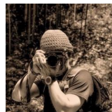
講師 Photographer 釜本 雅之さん

活動やイベントの写真を撮って見たけれど、パツとしない… そんなモヤモヤありませんか？ 同じ被写体でもほんの少し角度を変えたり、ちょっとした道具やコツでとても魅力的な写真になります。 今回の講座は、その場でレクチャーしてもらえる実践形式で、 雰囲気のある写真を撮るスキルを学びます。ぜひご参加を！